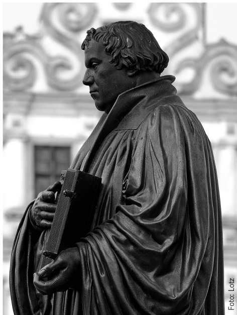
Lutherdenkmal auf dem Marktplatz in Wittenberg

Am 18. Februar 1546 wacht Luther um ein Uhr früh auf. Er hat starke Schmerzen in der Brust und Schüttelfrost. Todesangst überkommt ihn: „Lieber Gott, mir ist sehr weh und angst – ich fahr dahin!“ Drei Mal betet er die Worte von Jesus am Kreuz: „In Deine Hände befehle ich meinen Geist. Du hast mich erlöst, Herr, Du treuer Gott“ (Psalm 31,6). Dann sackt er weg. Jonas und Coelius wollen überprüfen, ob der Sterbende auch jetzt fest im Glauben steht. Sie schreien ihn an: „Allerliebster Vater, bekennt ihr Christus, den Sohn Gottes, unse-